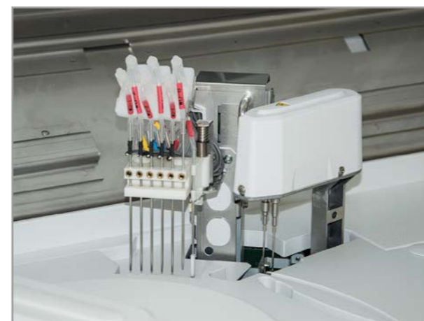
Модуль промывки кювет